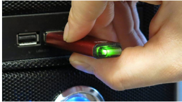
Aftenposten 8.okt