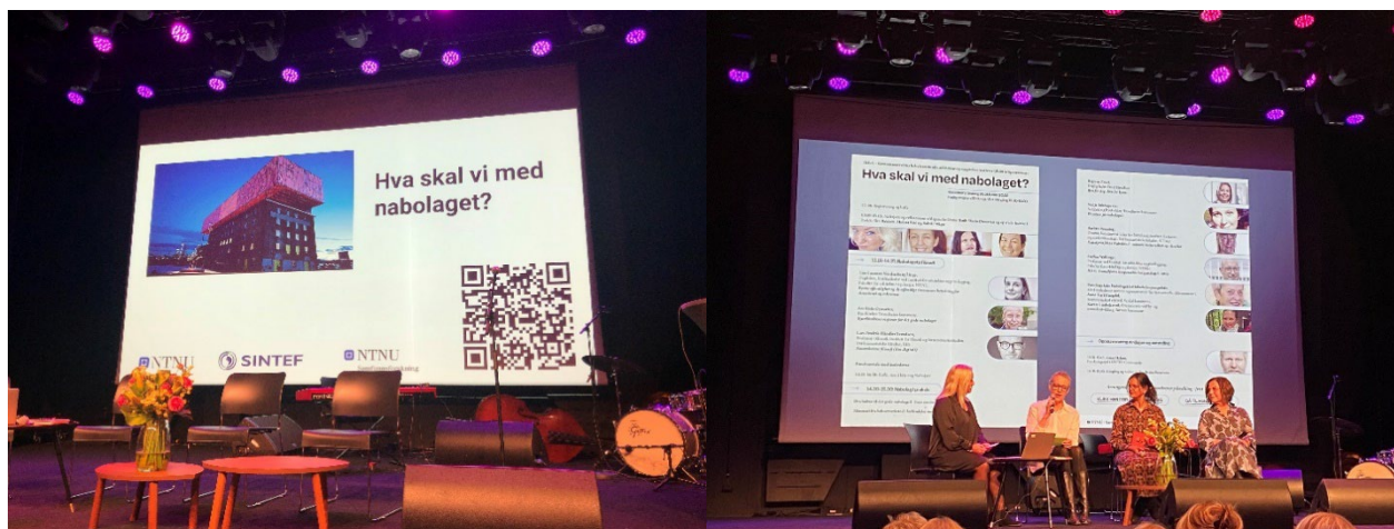
Fra HelsA-seminaret «Hva skal vi med nabolaget?», Rockheim 18.10.22